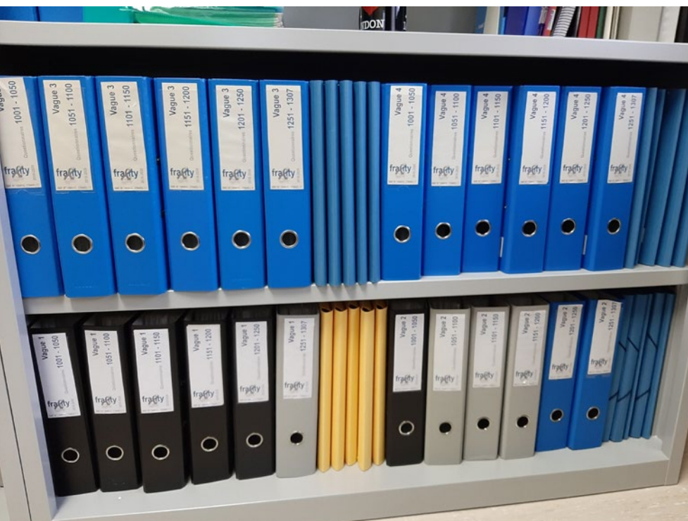
L'ensemble du matériel récolté lors des interviews: une masse de données consignées par écrit.

une bonne collaboration de groupe et l'élaboration d'une vision partagée dans les domaines de la compréhension des questions et réponses, ainsi que dans les modalités de codage. Nous avons pu mobiliser des compétences infirmières en les mêlant à des compétences méthodologiques et pédagogiques afin de contribuer à l'apport de nou-