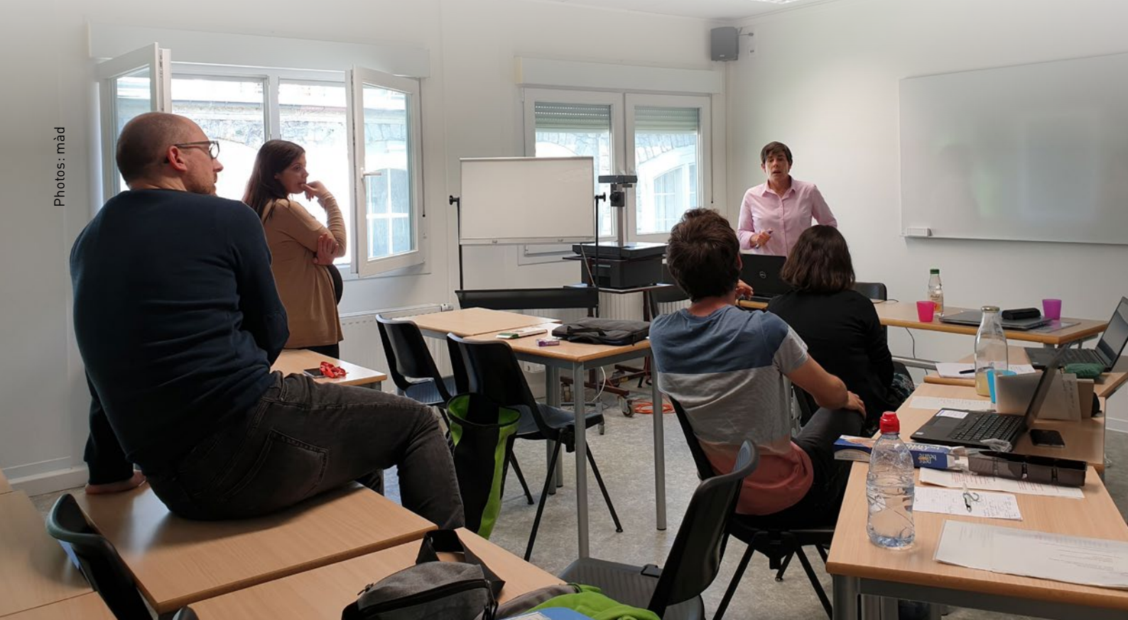
Les infirmières et infirmiers de l'équipe fraXity en séance de travail collectif pour identifier les thématiques d'analyse de données de recherche.