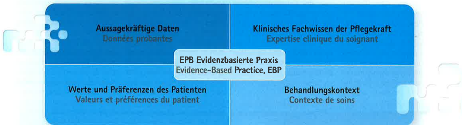
Abbildung 1: Die vier Säulen der EBP. Angepasst aus: Dawes et al., (2005); DiCenso, Guyatt, & Cliska, (2005); Sackett, Rosenberg, Gray, Haynes, & Richardson, (1996); Straus, Glasziou, Richardson, & Haynes Brian (2018)

sionnels de la santé en tant qu'agent de changement (3). Elle est en phase avec la politique actuelle qui souhaite intégrer le patient comme partenaire de sa prise en charge (4,5). En outre, d'un point de vue légal, l'article 32 de la loi fédérale sur l'assurance-mala-