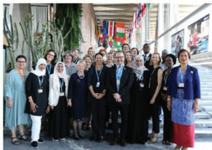
The International Year of the Nurse and Midwife will be extended in Europe in the wake of the coronavirus pandemic, it has been announced.