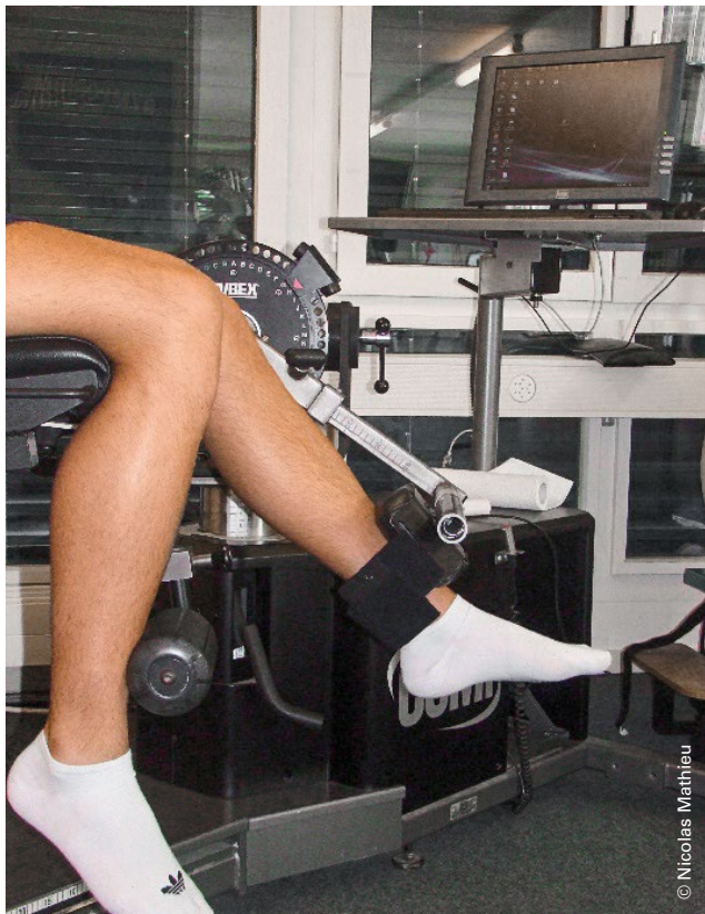
Abbildung 2: Isokinetischer Krafttest. | Illustration 2: Test isocinétique.

ten mit einem isokinetischen Dynamometer gemessen. Dabei ermöglicht es unkompliziert präzise und reproduzierbare Kraftmessungen (Abbildung 2) [10].