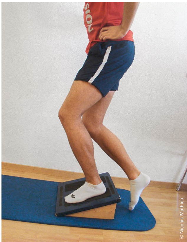
Abbildung 4: Einbeiniger Squat auf schiefer Ebene (Knie hinter Zehen). Illustration 4: Fente avant sur plan incliné (genou derrière orteils).