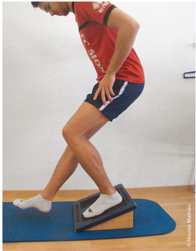
Abbildung 3: Einbeiniger Squat auf schiefer Ebene (Knie vor Zehen). Illustration 3: Fente avant sur plan incliné (genou devant orteils).

Für die muskuläre Rehabilitation des Patellaspitzen-syndroms setzen Sportphysiotherapeuten routinemäßig Squats auf einer schiefen Ebene (Decline Squat) ein, um die Intensität der Quadrizepskontraktion zu erhöhen.