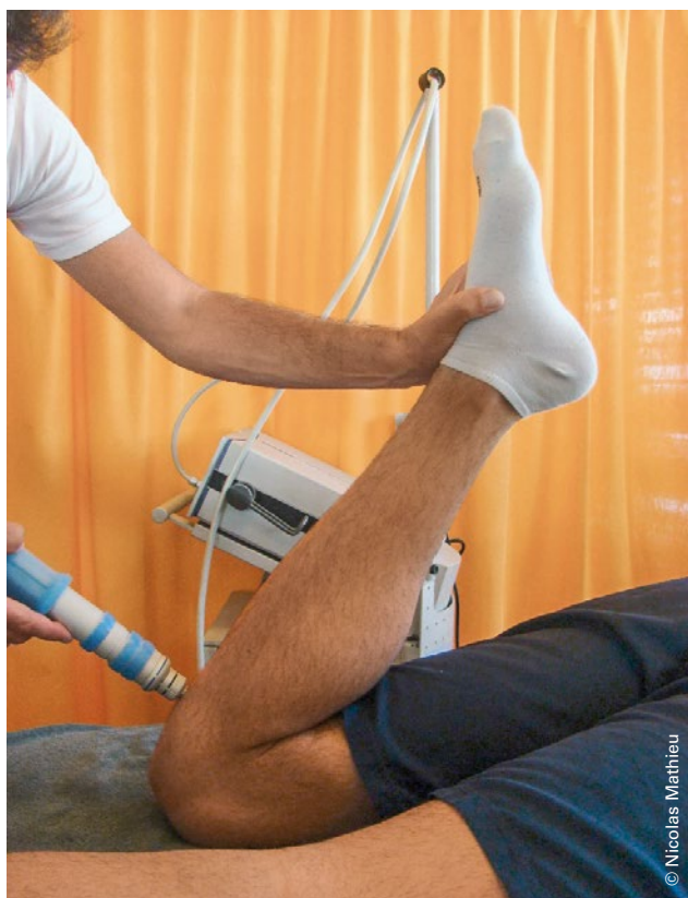
Abbildung 5: Extrakorporale Stosswellentherapie. | Illustration 5: Traitement par ondes de choc extracorporelles.

Beim einbeinigen Squat auf schiefer Ebene mit Ausfallschritt nach vorne sind die Belastung der Patellasehne, die Kraft des M. quadriceps, das maximale Drehmoment des Knies und der Flexionswinkel des Knies höher, wenn sich das Knie über die Zehen hinausbewegt (A) (Abbildung 3). Dies wiesen Zellmer et al. (2019) nach [13]. Die Belastung beim Schritt ist geringer, wenn das Knie hinter den Zehen bleibt (B) (Abbildung 4). Folglich wird die Patellasehne bei Übung A mehr belastet als bei Übung B.