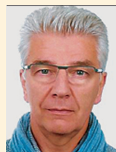
Pr Henk Verloo Sion

Dès lors, une compréhension élargie de la conception de la qualité de vie permet d'opérationnaliser le concept de la qualité de vie composée en incluant des facteurs d'ordre objectif (p. ex. incapacités physiques et cognitives), subjectif (p. ex. caractéristiques individuelles: convictions politiques ou religieuses, appréciation de sa propre vie selon les valeurs et les objectifs qui fondent la conception personnelle d'une vie réussie, etc.) et fon-