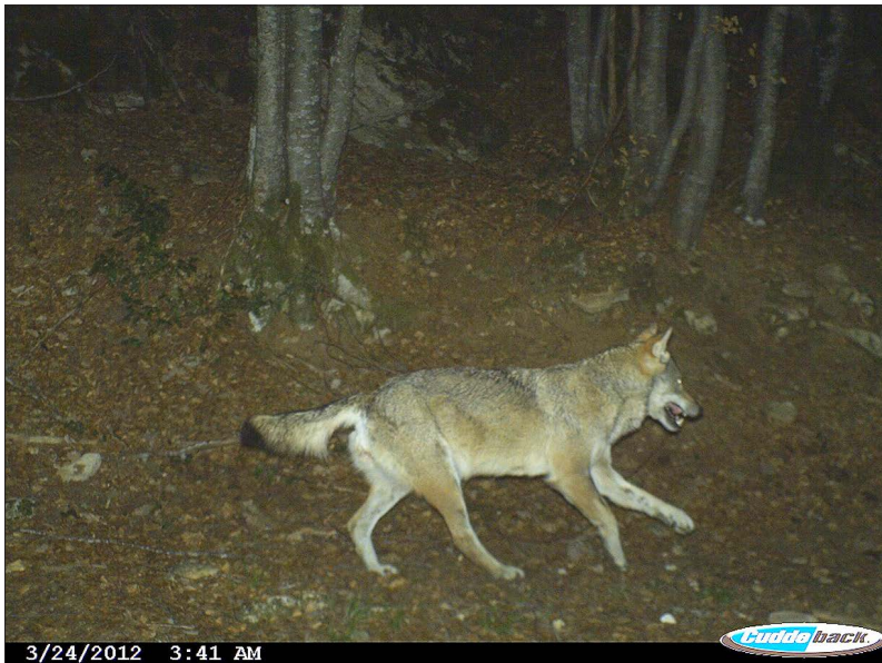
Fig. 3. Cliché du loup pris par l'un des pièges photographiques.

sur le massif, car la méthode utilisée a été reprise d'un protocole validé par le KORA. Il est cependant tout de même envisageable qu'un individu soit resté non détecté ; les captures étant moins probables par faible densité. Nous avons par contre eu la surprise de photographier à plusieurs reprises un loup, qui correspond probablement à l'individu dont une crotte a été retrouvée quelques semaines plus tard à l'ouest du massif et qui a été typé génétiquement. Ce même individu a ensuite été ré-identifié génétiquement en Haute-Marne en 2013 (Duchamps et al. 2016).