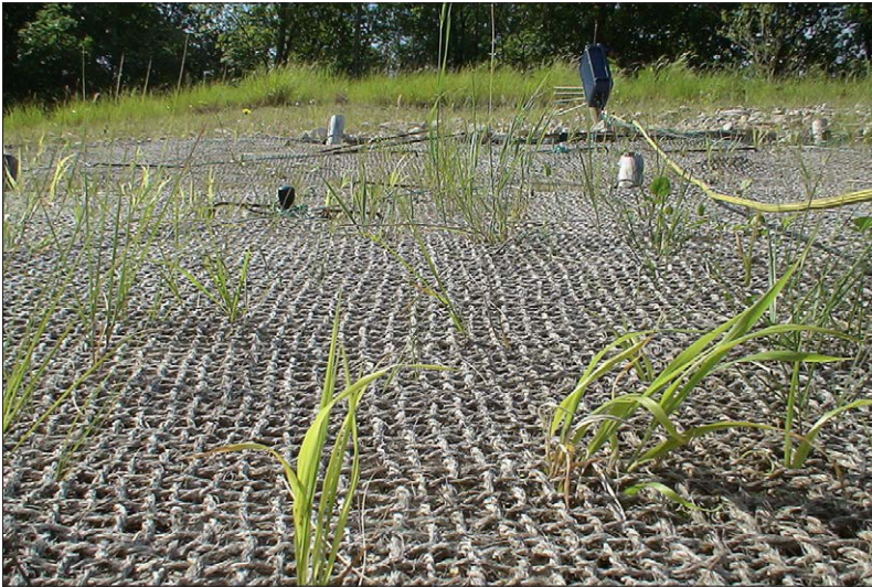
Fig. 4. Physionomie générale de la végétation de la placette P.

le laiteron rude. Enfin, parmi le couvert homogène de la végétation, les individus en place sont globalement chétifs et à feuilles peu développées (Fig. 5).