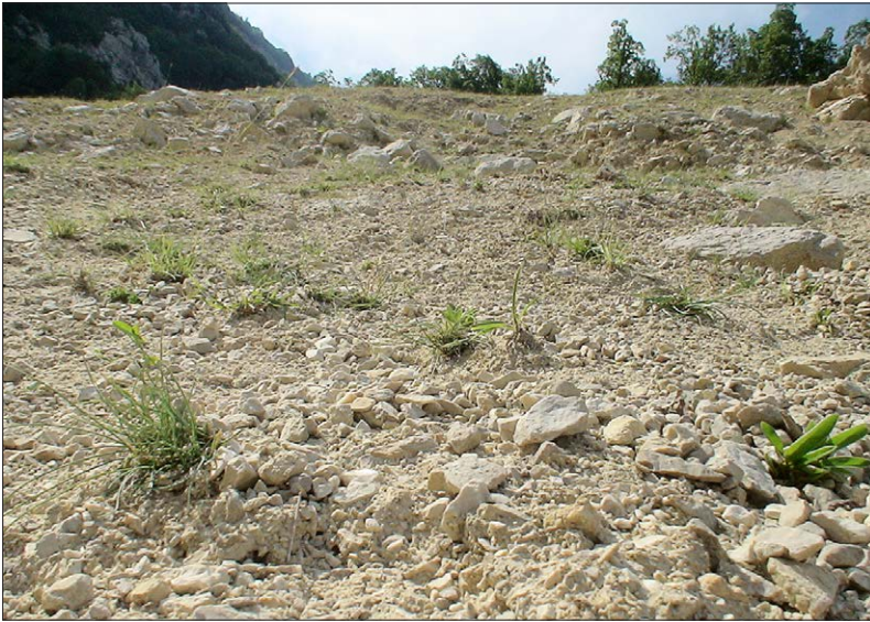
Fig. 6. Physionomie générale de la végétation de la placette E-bp.

Sur l'ensemble des placettes, ce sont les espèces figurant dans la liste du mélange semé qui occupent la majorité du couvert de la végétation (en moyenne 90%).