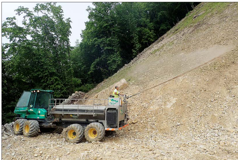
Fig. 2. Projection hydraulique du mélange grainier constitué à l'aide d'une lance à eau (04.05.2015).