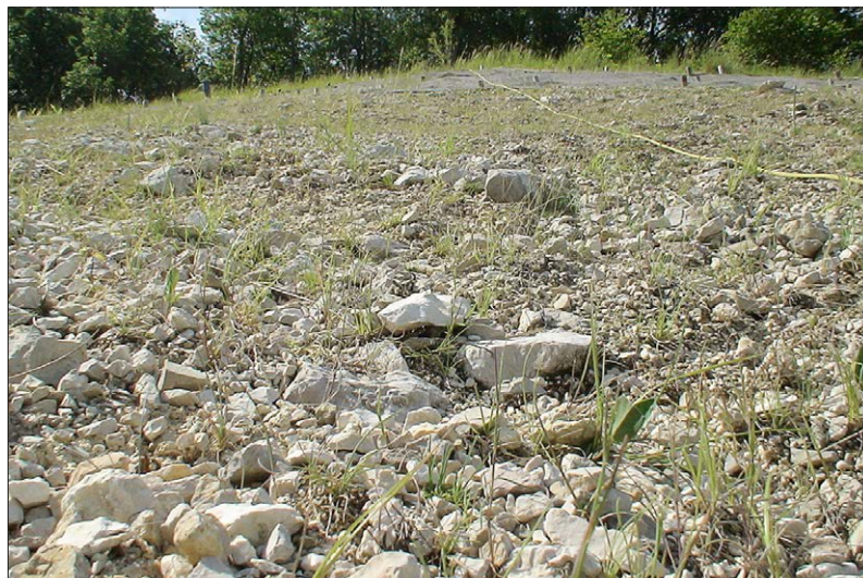
Fig. 5. Physionomie générale de la végétation de la placette E-hp.

en bas de pente (placette E-bp ). Il est uniquement occupé par les espèces indigènes ensemencées. Les trois espèces dominantes sont le brome dressé avec un taux de recouvrement de 4 %, la fétuque courbée