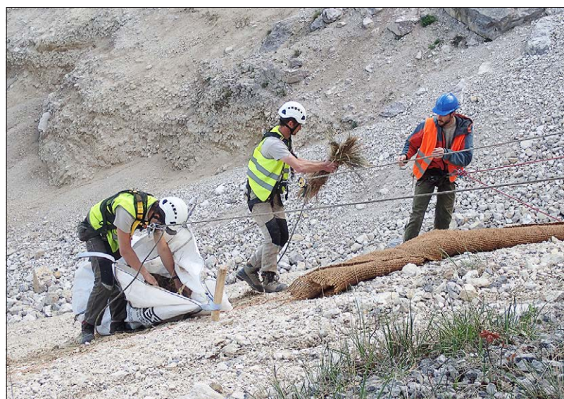
Fig. 1. Paillage d'inflorescences de stipes calamagrostides sous un géotextile fixé (30.04.2015).

De 2015 à 2017, un suivi annuel du développement de la végétation a été réalisé au sein du site d'étude (en juin 2015, décembre 2016 et juin 2017). Un quatrième