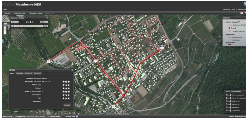
Figure 3. Exemple de traitement du réseau de distribution de gaz naturel au sein de l'outil cartographique MEU / Example of treatment of the natural gas distribution network within the mapping tool MEU.