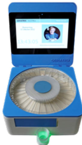
Abbildung 1: Gerisana® Smart Pillbox (Prototyp)

Die Gerisana® Smart Pillbox verdeutlicht exemplarisch die bedeutende Rolle von Pflegefachpersonen im Entwicklungsprozess digitaler Technologien (Abbildung 1).