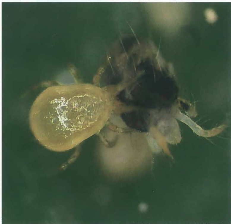
Figure 1 | Neoseiulus fallacis attaquant Tetranychus urticae (Lefebvre 2010).

Renseignements: Dominique Fleury, e-mail: dominique.fleury@eichangins.ch, tél. +41 22 363 40 43, www.eichangins.ch