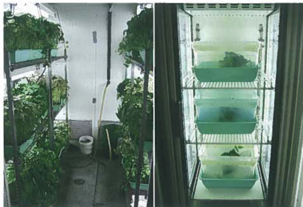
Figure 2 | Élevage de Tetranychus urticae (à gauche) et de Neoseiulus fallacis (à droite).

d'âge aléatoire, prélevées de l'élevage précédemment décrit, sont déposées avec trente à quarante T. urticae adultes. Une répétition est formée de dix boîtes de Pétri par modalité (fig. 3a). La pulvérisation des insecticides est effectuée avec un injecteur à chromatographie Kontes (fig. 3b) à une pression de 10,3 kpa (1,5 PSI)