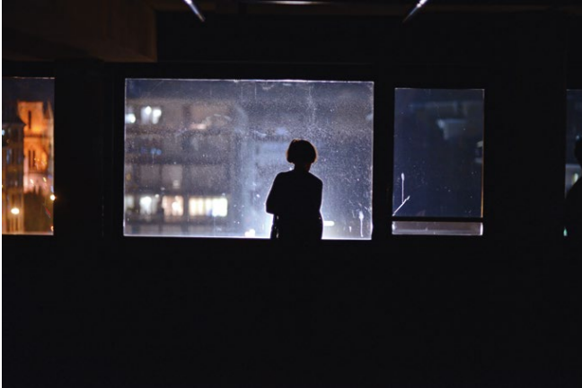
Tomason au Théâtre Saint-Gervais (Genève), novembre 2021

Published in Le journal de la recherche de la Manufacture Haute école des arts de la scène, 2022, no. 3, pp. 8-10 which should be cited to refer to this work.