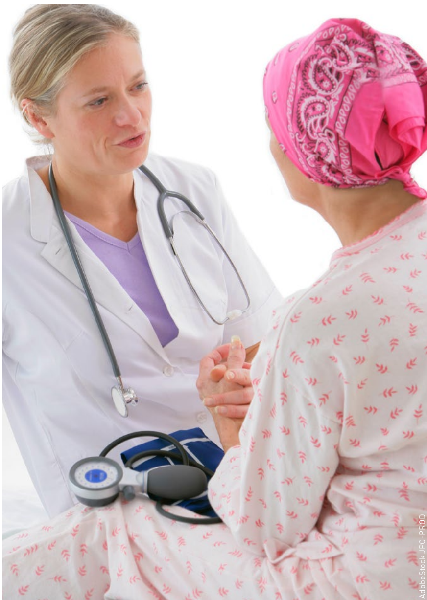
A l'aide d'entretiens éducatifs structurés, les infirmières encouragent les personnes atteintes d'un cancer à gérer elles-mêmes leurs symptômes.

Les infirmières et infirmiers mènent donc des entretiens éducatifs avec les personnes concernées, adaptés à leur situation individuelle. Lors des entretiens, ils sélectionnent les informations fournies par les dépliants SN en fonction des besoins et des capacités des personnes accompagnées et utilisent les cinq A (assess, advice, agree, assist, arrange – évaluer, conseiller, définir, assister, organiser) pour structurer les entretiens (Lawn and Schoo, 2010). Les cinq A donnent aux entretiens éducatifs un cadre flexible qui est également applicable au quotidien dans un contexte de soins très chargé. Les infirmières et infirmiers sont formés à l'utilisation des dépliants SN et à la conduite d'entretiens semi-structurés dans le cadre d'une formation de quatre heures. Ensuite, ils appliquent le PSN et acquièrent une première expérience. Environ deux