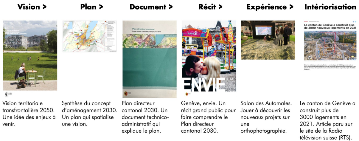
Figure 1. Usage du récit de communication en urbanisme : un modèle linéaire