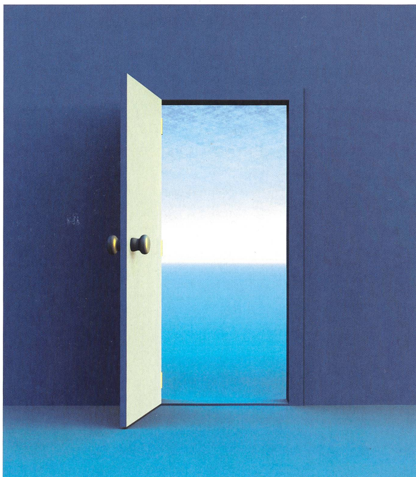
La situation de marché modifiée exige une nouvelle stratégie.

Par ailleurs, puisque le marché suisse de l'électricité prépare son ouverture, de nombreux acteurs énergétiques tant publics que privés (collectivités publiques, sociétés de distribution, etc.) se sont regroupés et vont continuer à regrouper leurs compétences et leurs ressources en établissant deux différents types de coopération, soit: