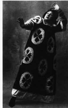
17. (gauche) Acteur de kabuki (estampe japonaise du XVIII e siècle) : remarquer que le regard en avant correspond à un basculement en arrière de l'épine dorsale. 18. (droite) Un acteur de la Comédie Française au début du siècle dans une expression de terreur accentuée par la courbure de l'épine dorsale.